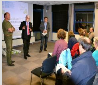
Pour la seconde saison consécutive, en lien avec l'Agence de l'Eau Seine-Normandie et le Conseil régional, la Communauté de communes des Trois Rivières poursuit l'opération « Les jardins s'emmèlent ». Au programme cette année, dix rencontres sont prévues autour du jardinage. Globalement, sont ainsi programmées des soirées d'échanges, des ateliers pratiques, des visites de jardins afin d'aider à jardiner autrement. La soirée de lancement du programme 2016 consacrée au compost et au paillage autour du thème « pour un jardin fertile, facile et économe » est prévue jeudi 21 janvier, à 20h, dans la salle de réunion du Sémaphore sur l'Espace Rotonde-Florentine.