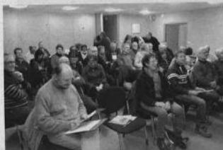
C'est un auditoire nombreux, qui a suivi l'exposé de l'animateur.

L'association « Les jardins s'emmèlent » qui distille informations et astuces aux jardiniers, a fait salle comble à l'occasion de sa première réunion de l'année.