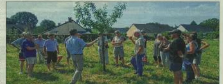
Plus de 200 personnes avaient participé à l'opération l'an dernier. Plus de la communauté de communes des Trois Rivières.

La deuxième opération de « Les jardins s'emmèlent » démarre ce jeudi. Soirées théoriques et ateliers pratiques sont prévus dans les Trois-Rivières jusqu'en juin.